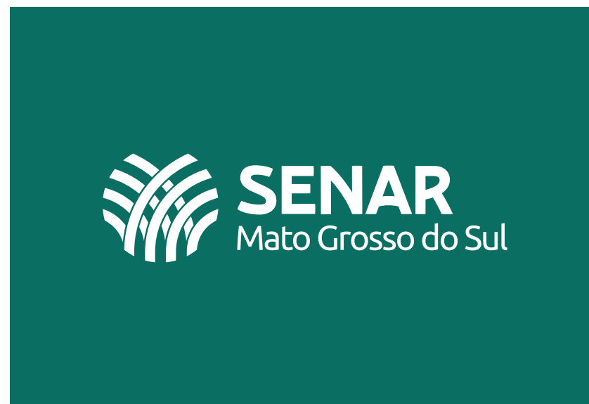
COSTA - LOGOMARCA SENAR-MS