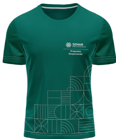
F R E N T E