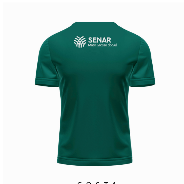
C O S T A